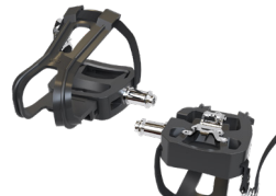
Pedales de cono Morse Double Link™ estándar