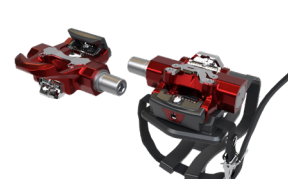
Pedales de cono Morse compatibles con Delta Triple Link™

Core Health & Fitness es más que equipamiento para gimnasios: ofrecemos soluciones innovadoras para todas las necesidades de tu centro. Por este motivo, hemos reunido cinco de nuestras marcas de fitness más reconocidas para garantizar a nuestros clientes que podrán ofrecer a sus socios experiencia auténticas de fitness. Ya sea trabajando directamente con nosotros o a través de nuestros socios y distribuidores de todo el mundo, ofrecemos el equipamiento de más alta calidad respaldado por un equipo de servicio y asistencia que hará todo lo posible para que tengas lo que necesites, cuando lo necesites. Asóciate con nosotros y conoce cómo los valores de Core motivan todas nuestras decisiones.