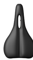
Sillín de carretera